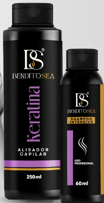
Keratina 250ml + shampoo 60ml