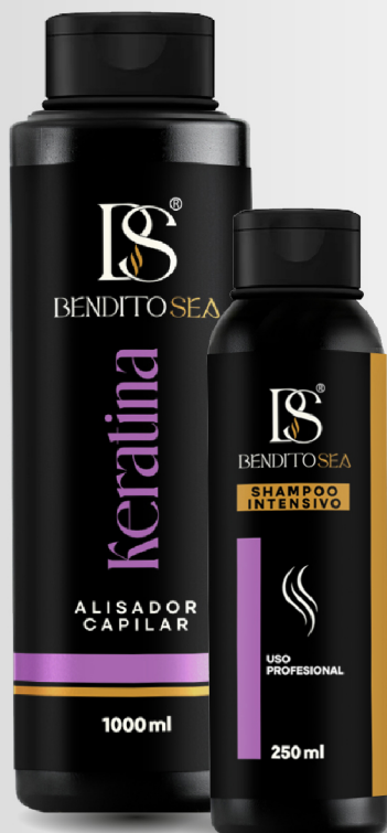
Keratina 1000ml + shampoo 250ml